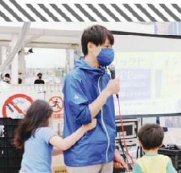
池川 友一 東京都議会議員。子どもの権利保障、理不尽な学校校則の改革などに取り組む。