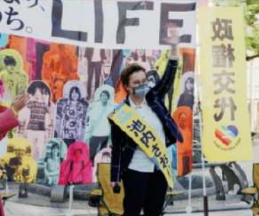
池内 さおり 前衆議院議員。刑法改正、ジェンダー平等、LGBTQなど人権問題に取り組む。