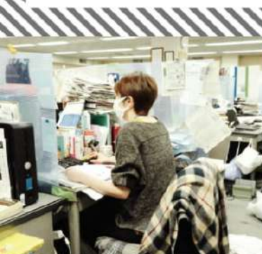
しんぶん赤旗 日本共産党の機関紙「しんぶん赤旗」。1928年創刊。読者数は約100万人。赤旗の事業は、党の財政収入の8割を占める。